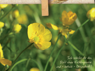
Ich schicke dir den Duft einer Frühlingsrose und - hatschi - Gesundheit!