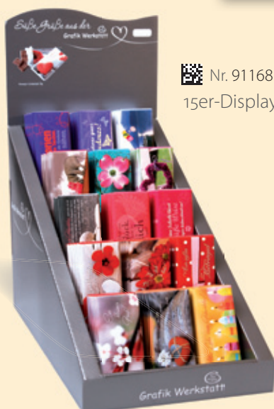
Nr. 91168 15er-Display