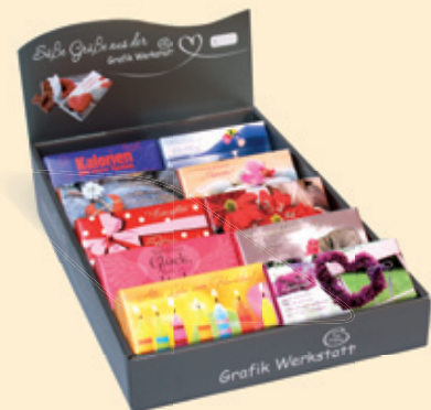
Nr. 91193 10er-Display