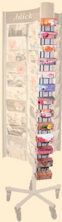
Nr. 91135 Leiste für Mini-Schokoladen

Farbenfrohe Motive zu verschiedenen Anlässen aus der Grafik Werkstatt umhüllen jeweils 50g Edel-Vollmilchschokolade (5,5 x 11 cm)